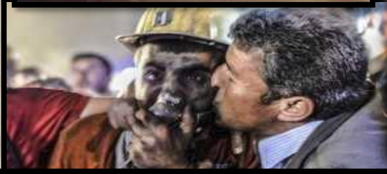
"Abi baretim kaybolmasın maaşımdan keserler."