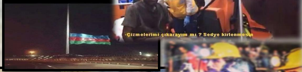
-Çizmelerimi çıkarayım mı ? Sedye kirlenmesin

Bunu nasıl yazsak, hangi cümleyi sarf etsek bilemiyorum, izleyebiliyoruz sadece ve susuyoruz. Bir acıyı ne kadar paylaşabilirsek yaşamadan; o kadar paylaşıyoruz, canımız acıyor, daha da kötü haber gelmesin diye umut ediyoruz her an her saniye... Yazılarımızın yarısını attık. Fotoğraflar konuşsun istedik, SOMA'da yaşanan faciayı ve oradaki madencilerimizin bize verdiği insanlık derslerini göstermek istedik sizlere, halkımızın, dünyanın, tepkilerini... - Kenan Şentürk